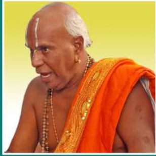
Therazhundhur Shri. U. Ve. K. Sriraman Bhattacharriyar Swamy