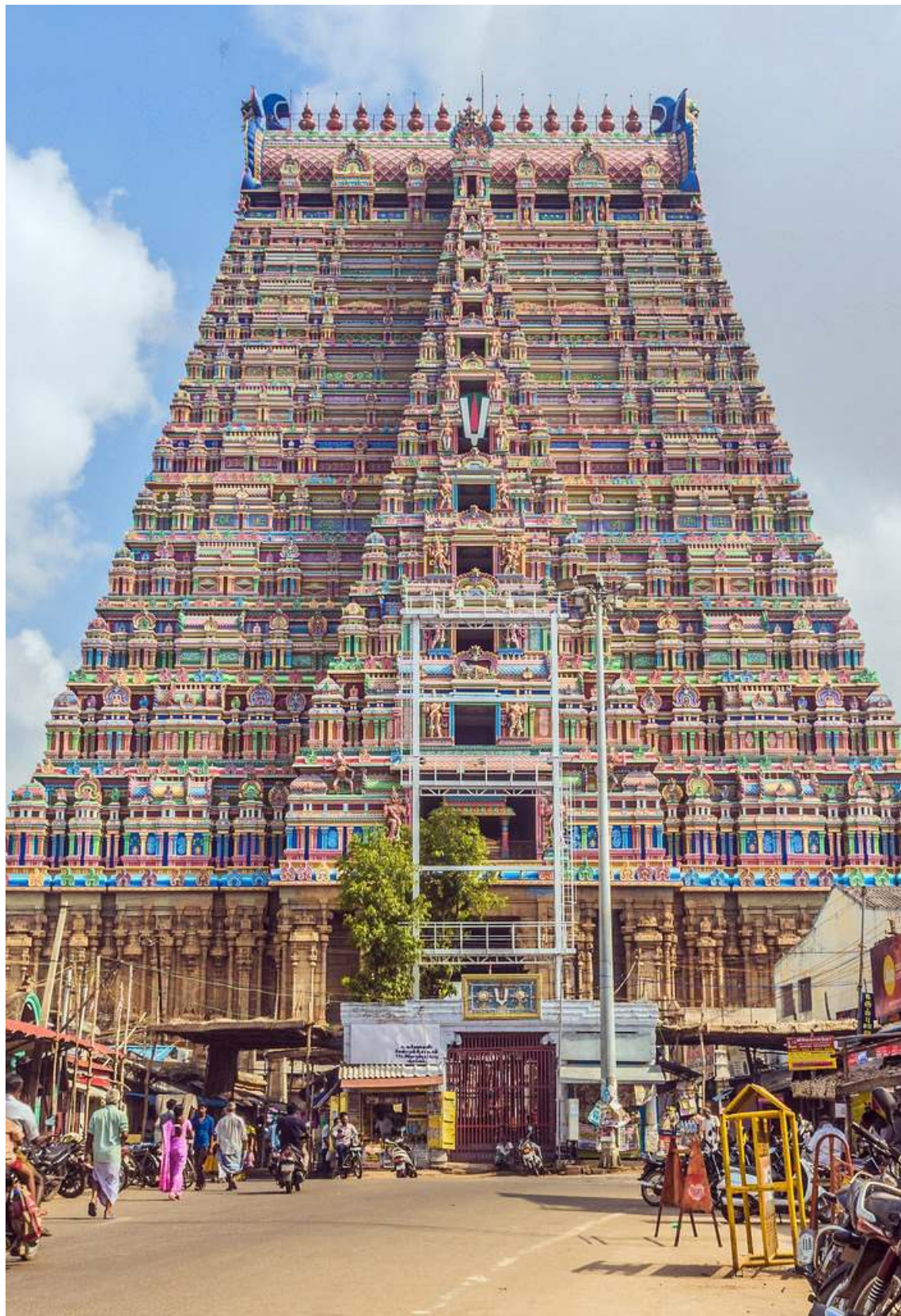
Aulmighu Sri Ranganathaswamy Temple Srirangam, Tiruchirapalli