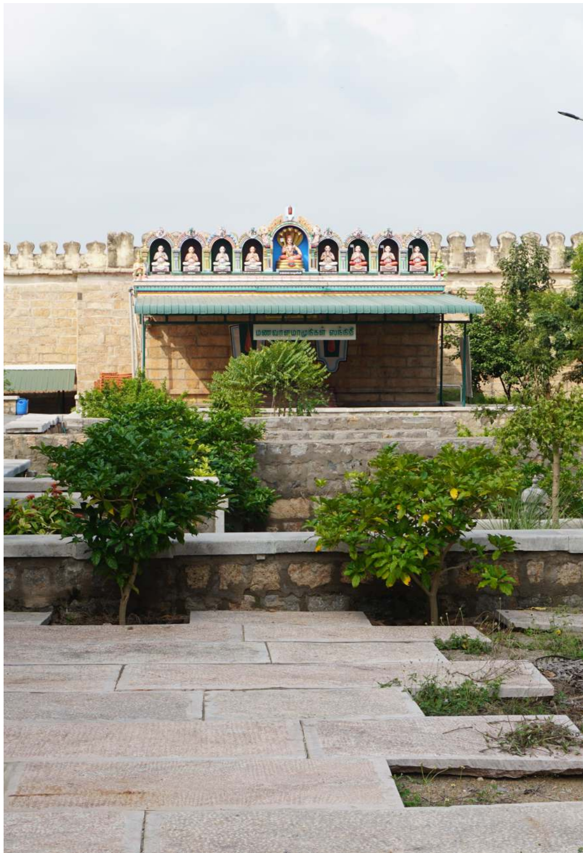
Shree Manavala Maamunigal Sannidhi Shree Pundarikatcha Perumal Temple - Thiruvellarai